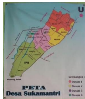
Gambar 3 Peta wilayah Desa Sukamantri